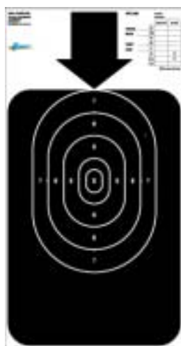
Officiell europeisk PPC tavla

För inomhusskjutbanor samt banor som inte har tillgång till 50 yards avstånd, finns en reducerad tavla för 25 yards. Tävlingar som använder reducerad tavla på 25 yards är inte klassningsgrundande.